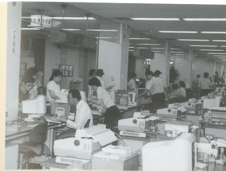
金沢市庁舎窓口センター

1 金沢市庁舎 ●広坂1丁目 ●昭和55年 ●鉄筋コンクリート造地下2階地上7階建 ●12,497㎡