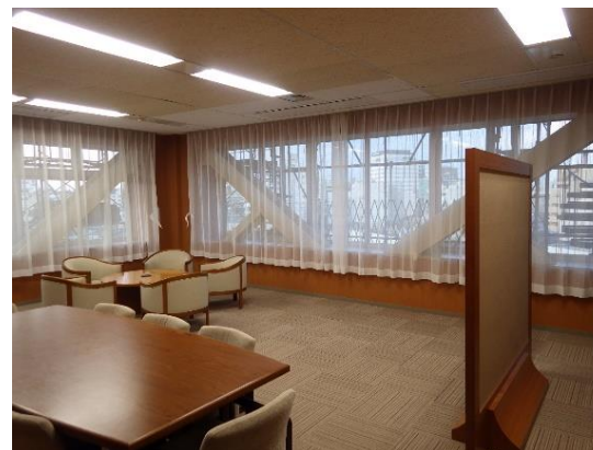
庁舎耐震改修工事第3期①

●広坂1丁目 ●昭和58年 ●鉄筋コンクリート造地下2階(一部)地上1階 ●5,720㎡