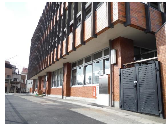
庁舎耐震改修工事第3期②