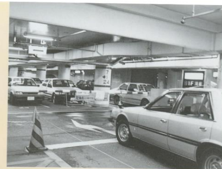
金沢市庁舎地下駐車場

●広坂1丁目 ●昭和58年 ●鉄筋コンクリート造地下2階(一部)地上1階 ●5,720㎡