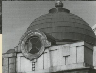
▲旧庁舎のドーム屋根

▲旧金沢市庁舎(大正11年建築) 屋根の中央部にサイレン塔を持ち、各部にアーチ型装飾をバランスよく配した近世ルネッサンス式の旧庁舎。