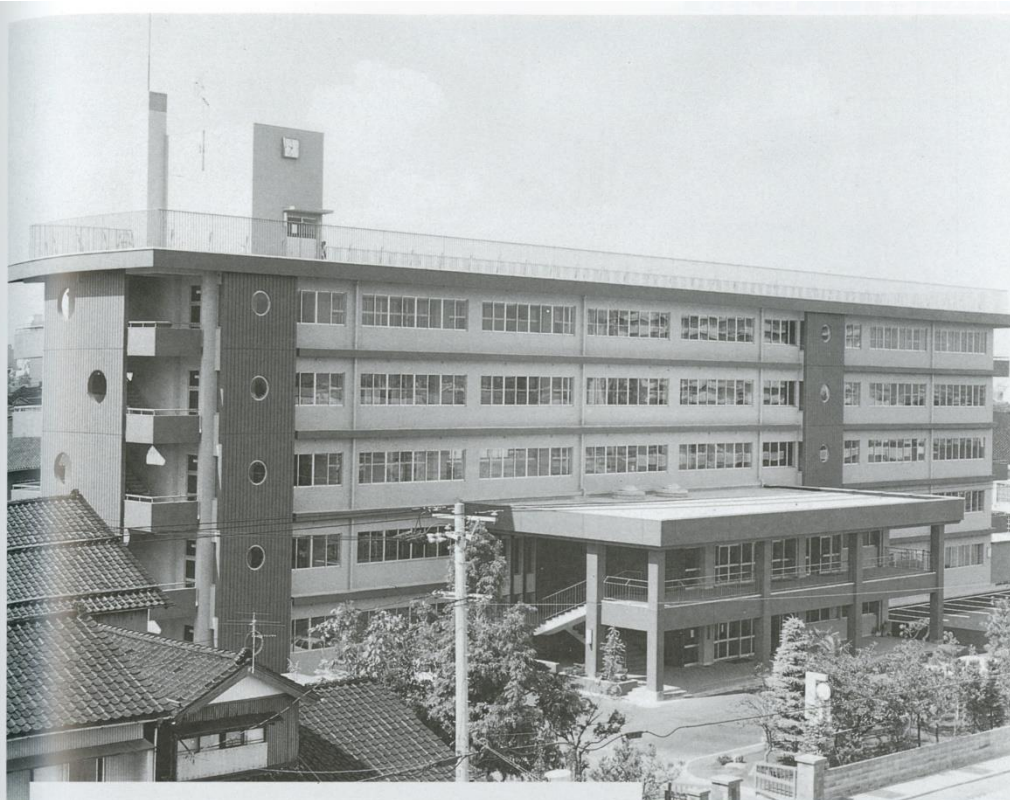
金沢で初めての5階建の中学校として建築された。