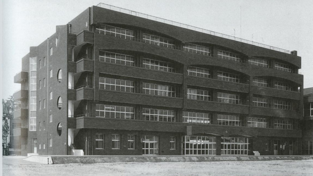
兼六園に近く、色彩、デザイン、外装など景観対策が特に配慮された。