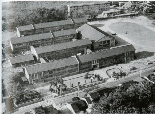
▲現校舎(昭和30年建築)