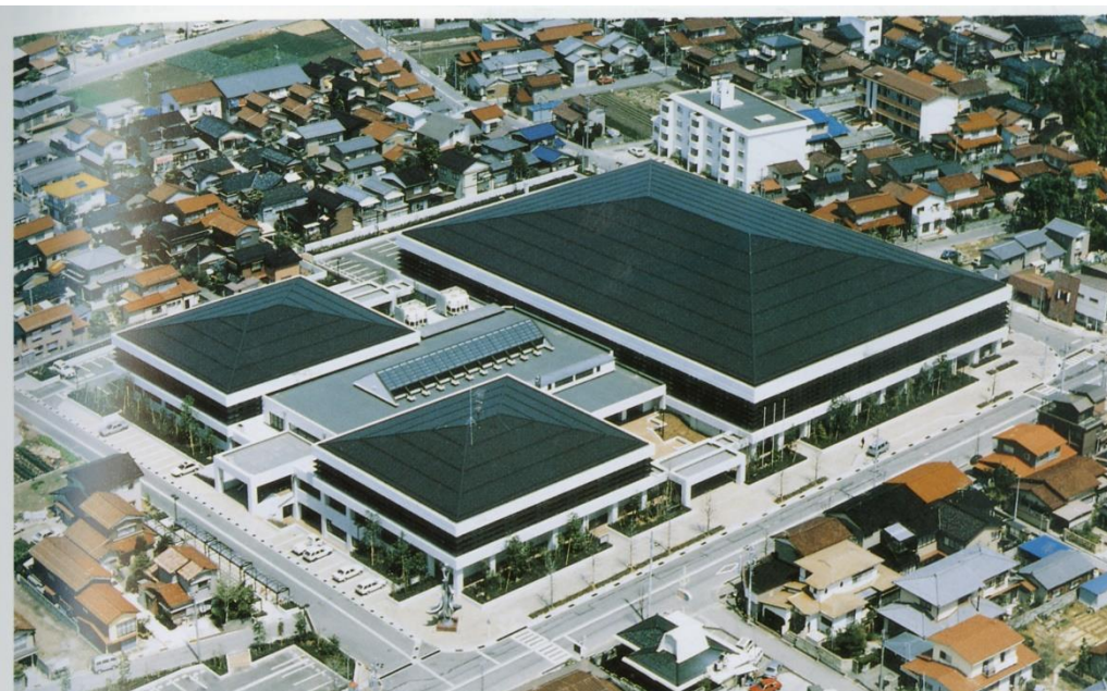
9 総合体育館 ● 泉野出町 ● 昭和59年 ● 鉄筋コンクリート造(一部鉄骨鉄筋コンクリート造)3階建 ● 12,859㎡