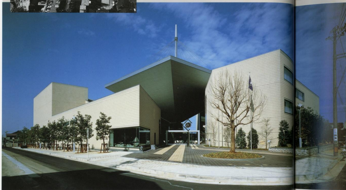
▶ライトアップ景観