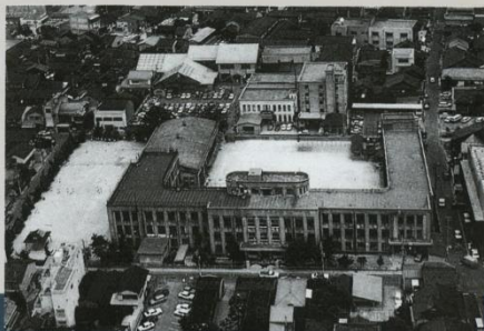
◀文化ホール敷地にあった 旧高岡町中学校 (昭和3年建築)