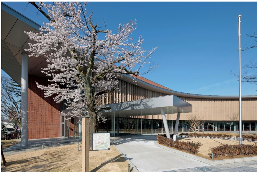
第二本庁舎建設工事 外観①