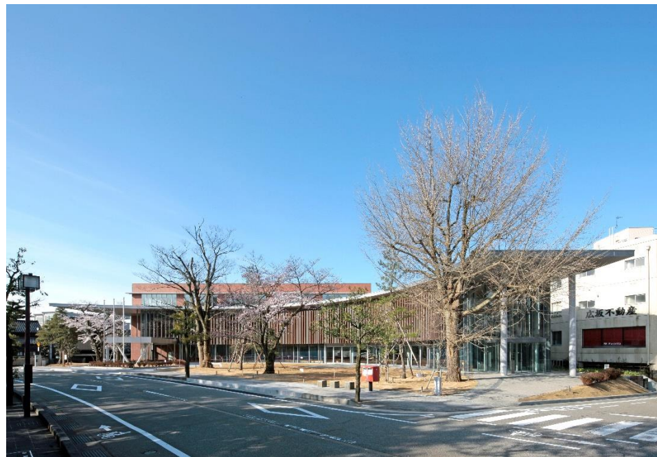
第二本庁舎建設工事 外観②