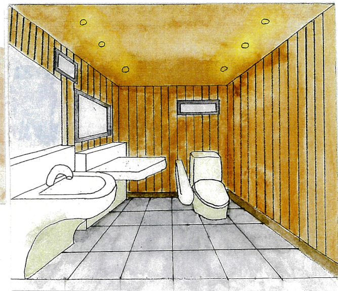
多目的トイレ内観パース